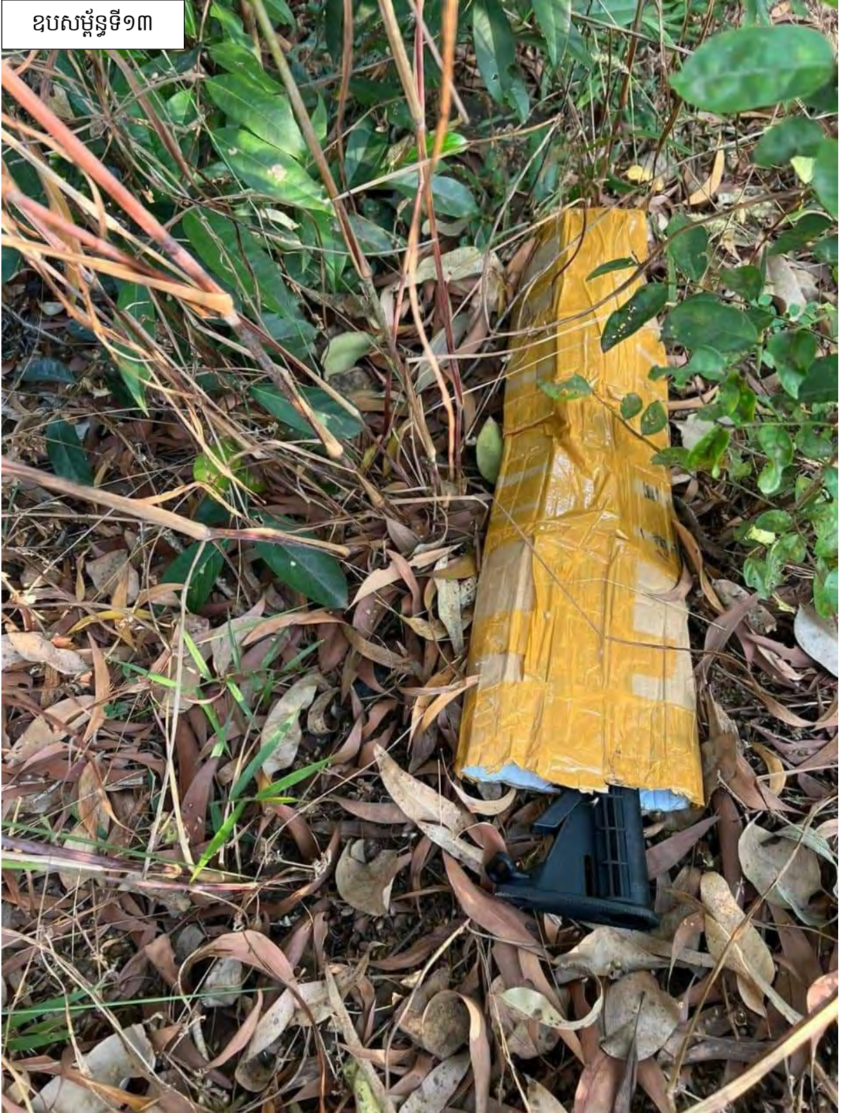
ឧបសម្ព័ន្ធទី១៣