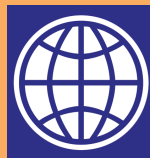
ធនាគារពិភពលោក