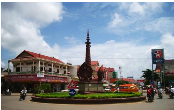
ទីតាំង៖ រង្វង់មូលនាគព័ន្ធ