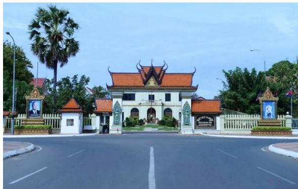
ទីតាំង៖ សាលាខេត្តកំពង់ចាម

ទីតាំងសំខាន់ៗនៅក្នុងរដ្ឋបាលក្រុងកំពង់ចាម និងសោភ័ណភាពក្រុងកំពង់ចាម