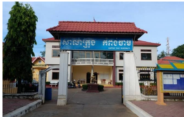
ទីតាំង៖ សាលាក្រុងកំពង់ចាម