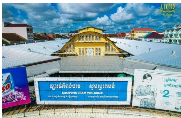
ទីតាំង៖ ផ្សារជំរុញកំពង់ចាម