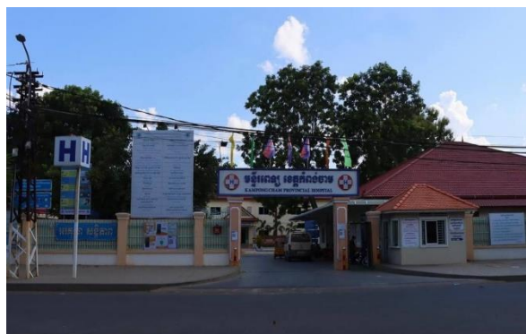
ទីតាំង៖ មន្ទីរពេទ្យខេត្តកំពង់ចាម