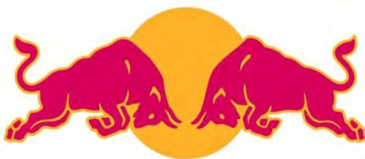
ម៉ាកជារូបសញ្ញា