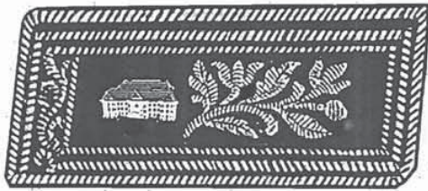
ស័ក្តិចុងកអាវ