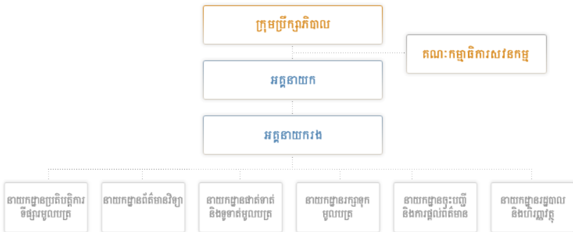
រចនាសម្ព័ន្ធគ្រប់គ្រងរបស់ក្រុមហ៊ុនផ្សារមូលបត្រកម្ពុជា ឧបសម្ព័ន្ធនៃបទបញ្ជាផ្ទៃក្នុងសម្រាប់ការគ្រប់គ្រង ផ.ម.ក